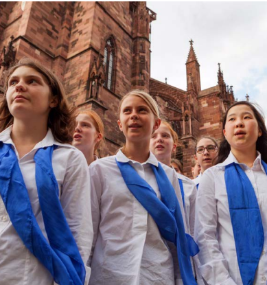
Mädchenkantorei, Freiburger Münster

WERKE VON HILDEGARD VON BINGEN, GABRIEL FAURÉ, JOSEPH RHEINBERGER, FELIX MENDELSSOHN-BARTHOLDY, OLA GJEILO U.A.