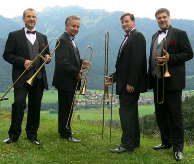
Posaunenquartett Opus4, Leipzig

WERKE VON GIOVANNI GABRIELI, CLAUDIO MONTEVERDI, HEINRICH SCHÜTZ, HANS LEO HASSLER UND JOHANN SEBASTIAN BACH